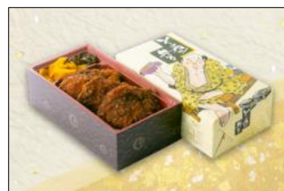
ソースかつ弁当 930円（税込）